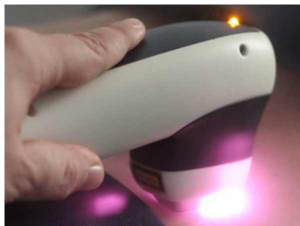
Das Epilations-Handstück des Asclepion MeDioStar NeXT Laser mit integriertem Peltier-Kühlelement

Im Handstück unseres Hochleistungs-Lasers sind mehrere Lasereinheiten (800 und 950 nm) integriert, die parallel Energie abgeben. Der Behandlungserfolg lässt sich an einer leichten Rötung (perifollikuläres Erythem) oder Schwellung (Ödem) des Haarfollikels ablesen.